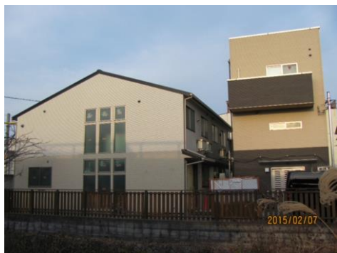
グループホーム外観